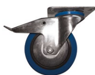
Roues en caoutchouc bleu non tâchantes silencieuses et jantes avec par-fils