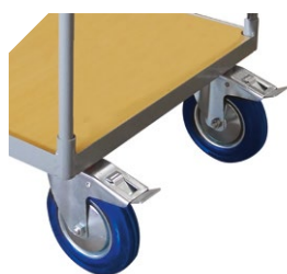
Deux roues pivotantes avec frein