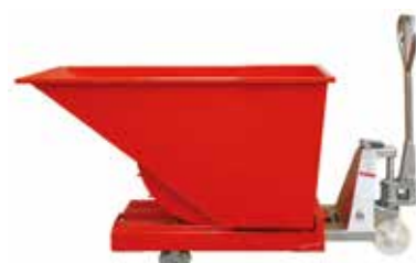
Déplacement manuel avec transpalette jusqu'à 1600 l