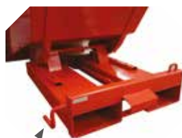
Déclenchement manuel ou réalisé directement du chariot élévateur à l'aide d'une chaîne ou d'un câble