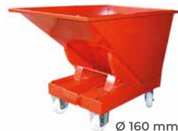
Ø 160 mm