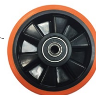
Roue caoutchouc silencieuse non marquante avec roulements à billes