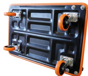
Structure et plateau renforcés en acier laqué avec revêtement antidérapant