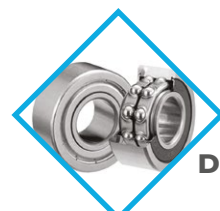
ROULEMENTS À BILLES DOUBLE ÉTANCHÉITÉ