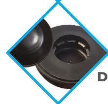
SYSTÈME DE BLOCAGE DE ROUE RENFORCÉ