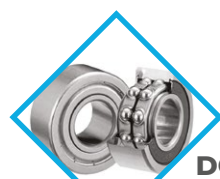
ROULEMENTS À BILLES DOUBLE ÉTANCHÉITÉ