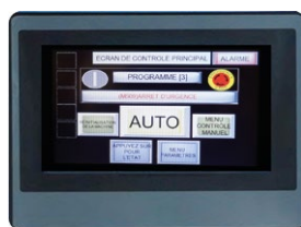
Panneau de contrôle tactile LED en français