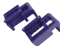
SBH Crochets de maintien pour bacs