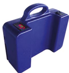
DME170/E-PD002 Batterie supplémentaire