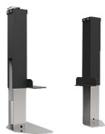
ELS420 Système de levage électrique pour CT420