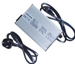
DME170/E-PD003 Chargeur standard