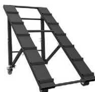
CT420RAMP Rampe pour CT420