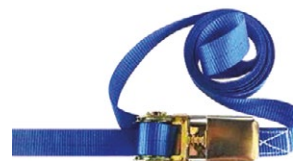
DME170/E-PD004 Sangle de sécurité