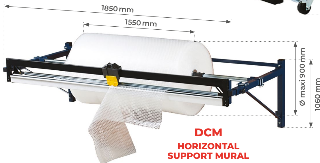
DCM HORIZONTAL SUPPORT MURAL